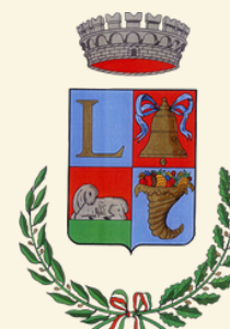
Comune di Loculi