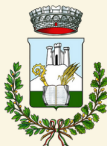
Comune di Galtelli

Per info rivolgersi agli operatori dei comuni competenza