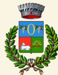
Comune di Onifai