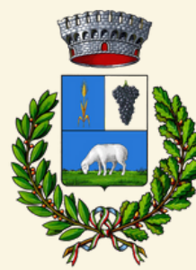
Comune di Irgoli